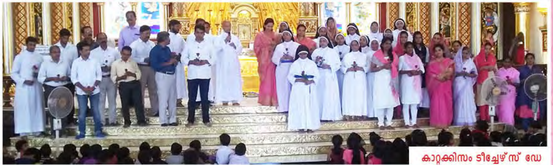
കാറ്റക്കിസം ടീച്ചേഴ്സ് ഡേ