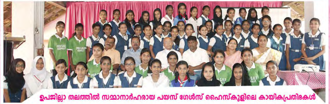
ഉപജില്ലാ തലത്തിൽ സമ്മാനാർഹരായ പയസ് ഗേൾസ് ഹൈസ്കൂളിലെ കായികപ്രതിഭകൾ