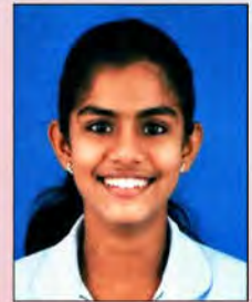
ANN MARGRET GEO ETTIL