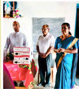
നമ്മുടെ സ്കൂളുകളിൽ പ്രളയാനന്തര ദുരിതാശ്വാസ സഹായം നൽകുന്നു